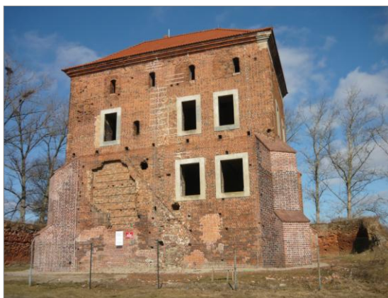
Zamek po remoncie