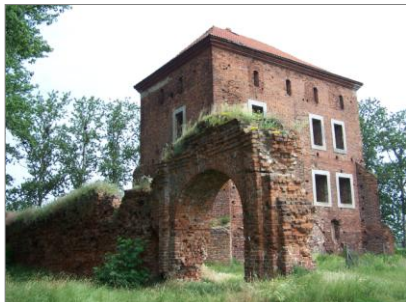
Przed remontem, zdjęcie ze zbiorów Gminy Gołańcz

Remont zabezpieczający wykonał właściciel – Miasto i Gmina Gołańcz.